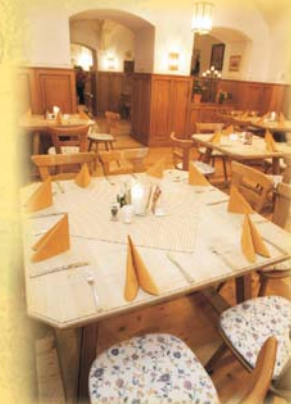
"Viktor v. Scheffel Stube"