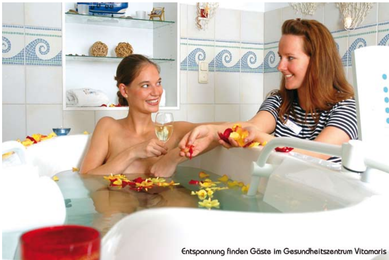
Entspannung finden Gäste im Gesundheitszentrum Vitamaris

fäßkrankheiten, Erkrankungen im Kindesalter und Erschöpfungszustände behandelt. Eine einladende Wellness-Oase mit FitWelt rundet das Leistungsspektrum des Vitamaris ab. Ein ebenso sinnliches wie sinnvolles Spektrum, das von Wellness-Behandlungen wie Wellness-Ayurveda, Hamam, Hot-Stone-Massage, Orientalischem Serail-Bad, Fitness und Kosmetik, Balneo-Photo- und Sauerstoff-Vital-Therapie über Cellulite-, Migräne-, Narben- und Schmerzbehandlungen bis hin zur vorsorglichen Therapie von Erkältungskrankheiten reicht. Aber nicht nur aus regenerativer, sondern auch aus sportlicher Sicht kann