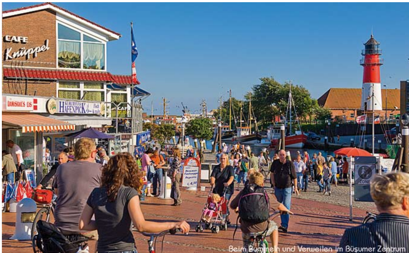
Beim Bummeln und Verweilen im Büsumer Zentrum

Wer nach so viel Genuss Lust auf einen Spaziergang hat, der macht sich dann einfach auf den kurzen Weg. Zum Beispiel ins Aquarium, zum Sandstrand oder zum Sturmflutsperrwerk. Und wer dann immer noch nicht genug Nordseeluft getankt hat, dem sei ein abendlicher Strandspaziergang wärmstens empfohlen. Denn hier erwarten einen nicht nur Wind, Wasser, Wellen und Weite, sondern