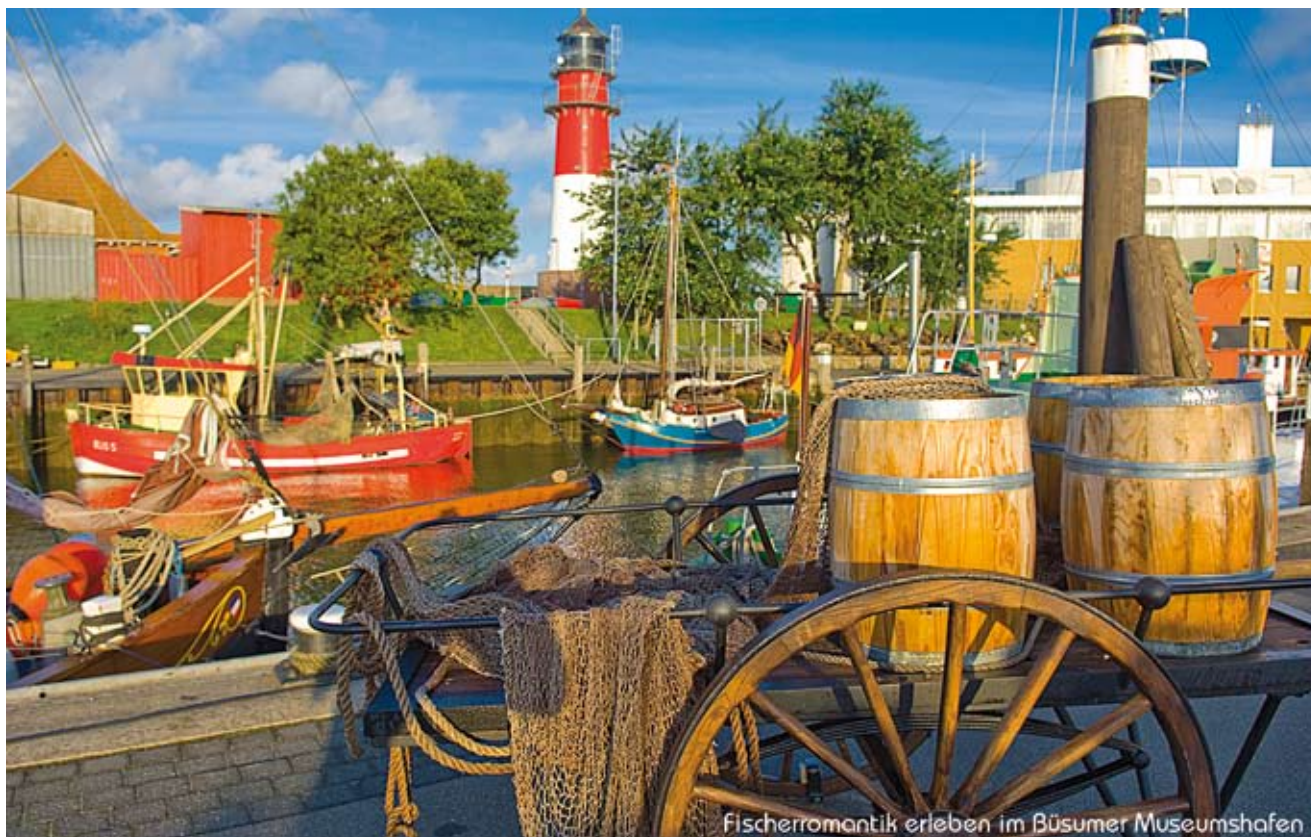
Fischerromantik erleben im Büsumer Museumshafen

Dithmarscher Küste zu einem beliebten und überaus lebendigen Kur- und Urlaubsort, der seinen natürlichen Charakter bis heute erhalten hat. Was nicht zuletzt auch an den zahlreichen naturgegebenen Attraktionen Büsums liegt. Attraktionen wie der 3,5 km lange Grünstrand oder der über 100.000 m 2 große Sandstrand in der „Perlebucht“, die mit ihren mehr als 2.000 Strandkörben zum ausgiebigen Sonnenbaden einladen oder auch Schutz bei Wind und Wetter bieten. Doch Büsum wäre nicht Büsum, wenn es nicht auch bei Ebbe eine Flut an Angeboten für seine Gäste bereithielte. So ist für viele Urlauber das Watt untrennbar mit dem reinen Nordseerlebnis verbunden.