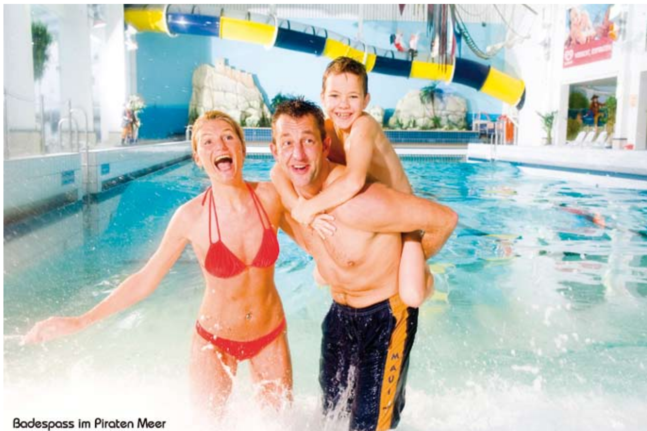
Badespaß im Piraten Meer

In Büsum kann man übrigens ganzjährig Baden. Denn direkt am Hauptstrand befindet sich das Freizeit- und Erlebnisbad „Piraten Meer“. Ein Bad in bester Lage mit einer atemberaubenden Saunalandschaft, das neben regelmäßiger Nordseebrandung, absolutem Badespaß und bunter Abwechslung noch weitere Highlights für die ganze Familie zu bieten hat. Hoch her geht es aber auch an anderer Stelle. Das Gäste- und Veranstaltungszentrum und das Vitamaris Büsum sind die zentralen Anlaufpunkte für jede Menge Abwechslung, Unterhaltung und Erholung. So finden in Büsum von April bis Oktober Kurkonzerte, Musik-, Theater- und