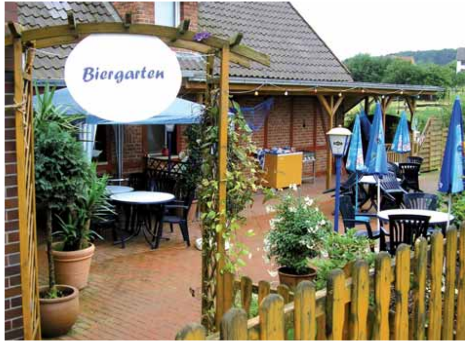
Gasthaus Zum kühlen Grund Napoleonstr. 3 • 31749 Auetal-Rolfshagen

Das Gasthaus ist jederzeit einen Besuch wert!!!!!! Ein Haus mit ländlich idyllischer Atmosphäre, fern ab vom Großstadt-Trubel.